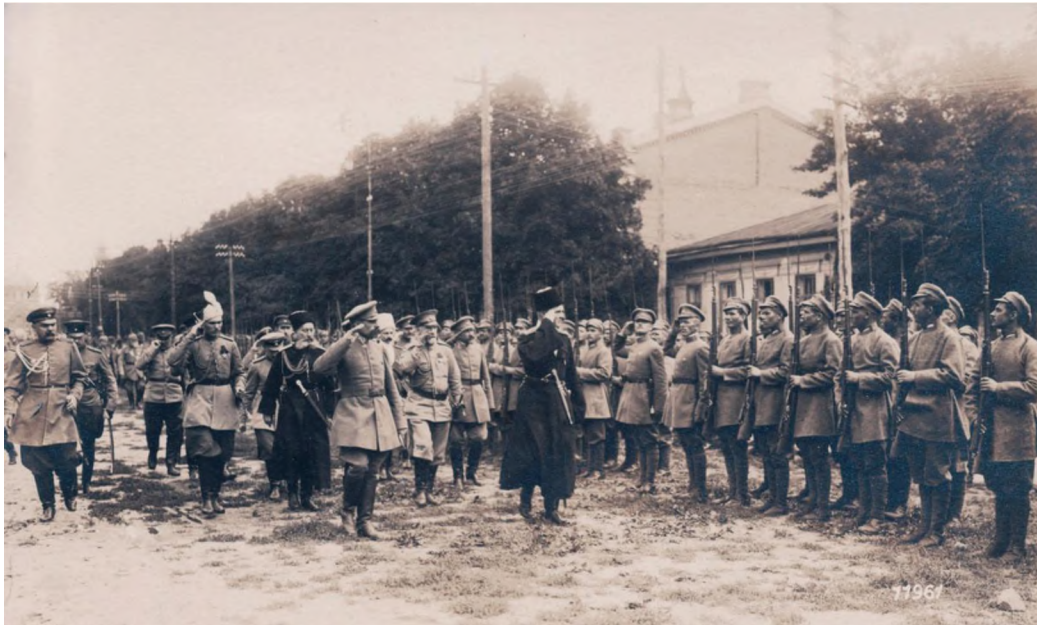
Гетьман Скоропадський зі штабом оглядає Сірожупанну дивізію. Серпень 1918 року